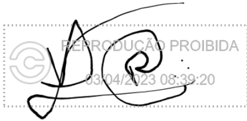
Vitor dos Santos Ribeiro 03 abr 2023, 08-39-20.png

Assinatura manuscrita com hash SHA256 prefixo 190fc4(...)